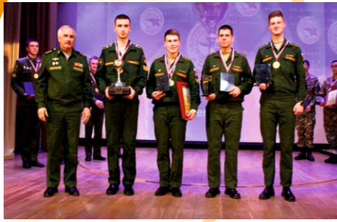
Победители олимпиады по английскому языку