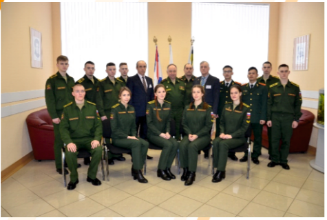
Победители олимпиады по химии